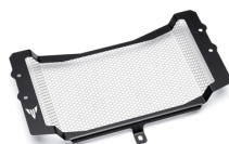
Kompletní kryt chladiče