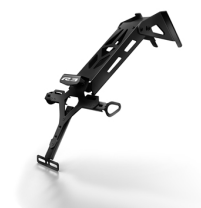
Držák registrační značky